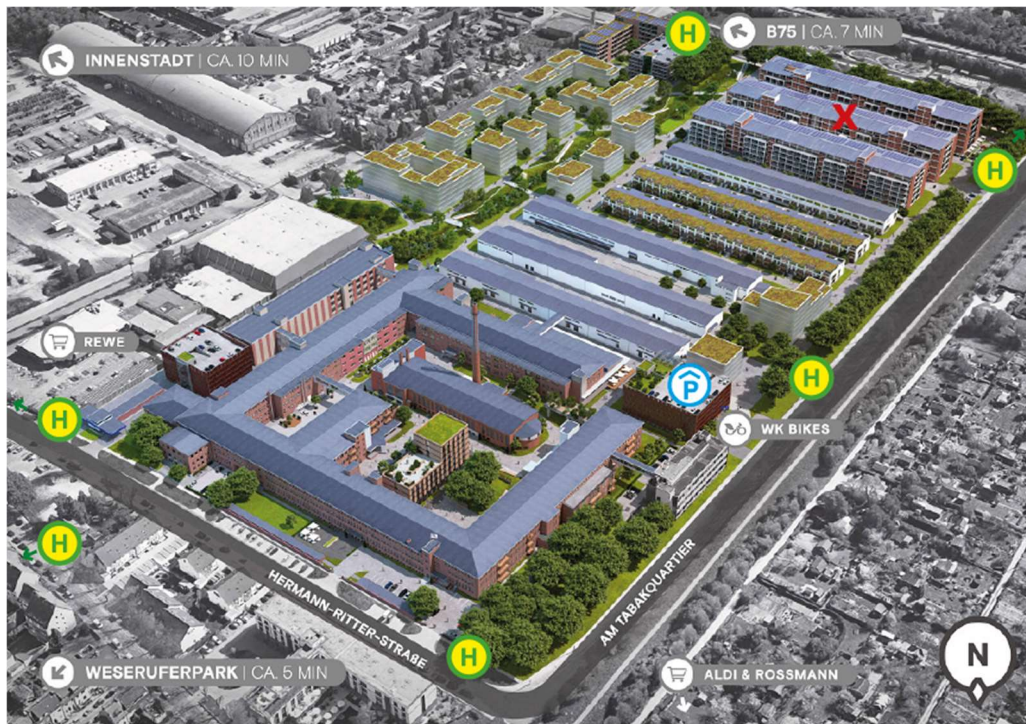
Tabakquartier - Innovationscampus Bremen

Adresse: Am Tabakquartier 56, 28197 Bremen